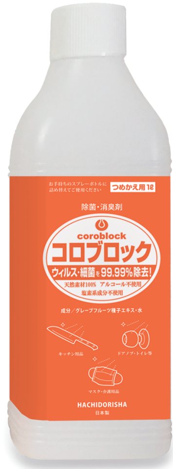
1L (つめかえ用) @2,400